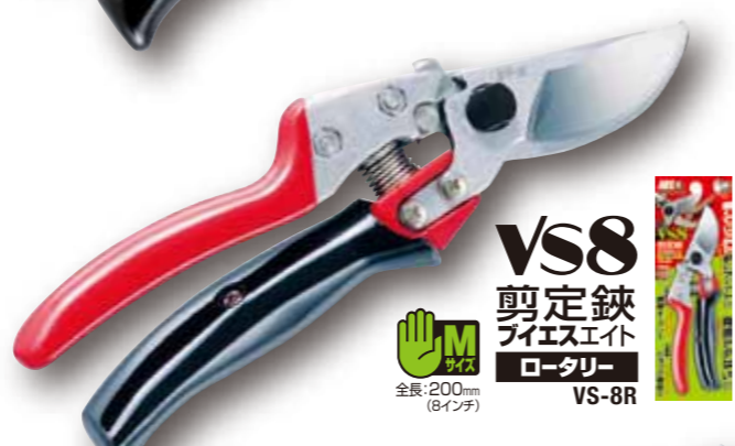
VS8 剪定鋏 ブイエスエイト ロータリー VS-8R 全長:200mm (8インチ)