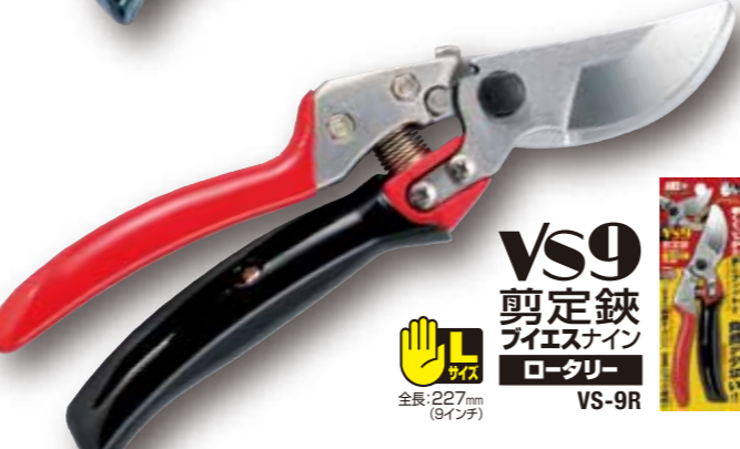
VS9 剪定鋏 ブイエスナイン ロータリー VS-9R 全長:227mm (9インチ)