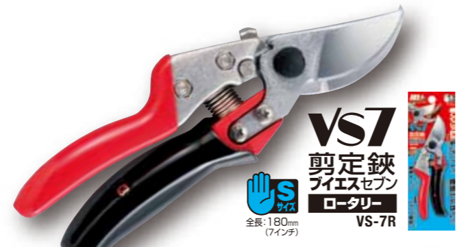
VS7 剪定鋏 ブイエスセブン ロータリー VS-7R 全長:180mm (7インチ)