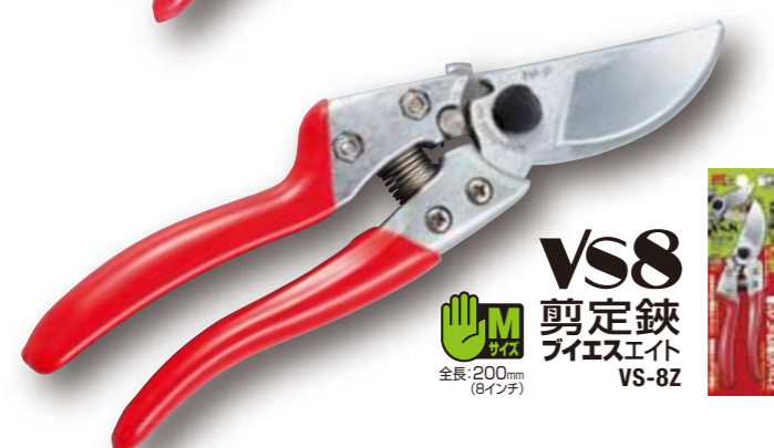
VS8 剪定鋏 ブイエスエイト VS-8Z 全長:200mm (8インチ)