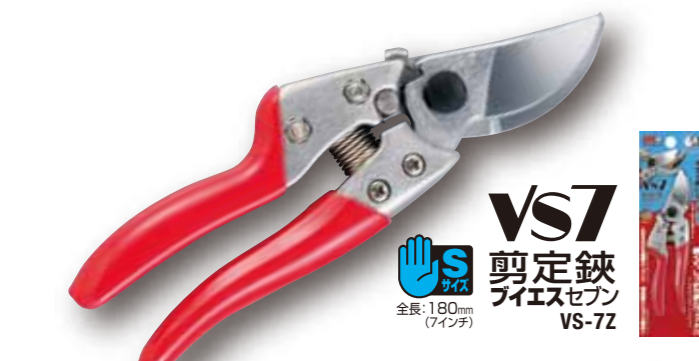
VS7 剪定鋏 ブイエスセブン VS-7Z 全長:180mm (7インチ)