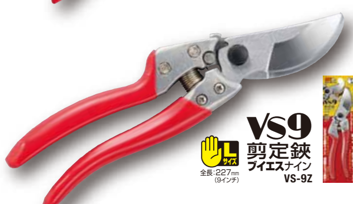
VS9 剪定鋏 ブイエスナイン VS-9Z 全長:227mm (9インチ)